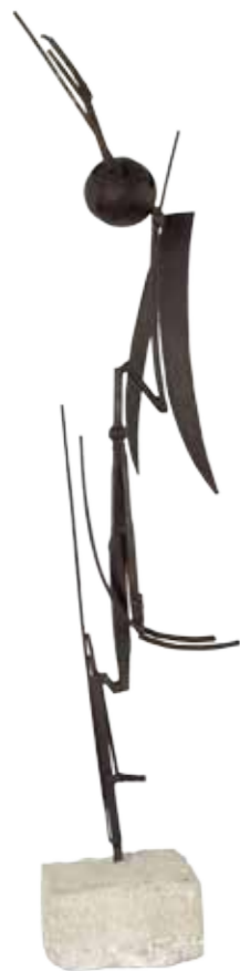
Julio González (1876-1942) - L'Ange, L'Insecte, La Danseuse - 1935, fer forgé et soudé sur socle en pierre, 163 x 41 x 35 cm - Achat en 1952 - Paris, Centre Pompidou - Musée national d'art moderne - Centre de création industrielle - AM9295