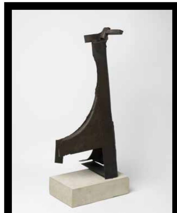
Julio González (1876-1942) - Femme assise III - 1935-1936 - fer forgé, 58 x 25 x 24 cm Dation en 2000 - Paris, Centre Pompidou - Musée national d'art moderne - Centre de création industrielle - AM2000-157

Cette collaboration se décèle aussi à travers l'important texte que Julio González consacra au début des années 1930 à son ami, « Picasso et les cathédrales, Picasso sculpteur » : « Je l'ai toujours tenu pour « un homme de la forme », car il a naturellement l'esprit de la forme. Forme dans ses peintures du début, forme dans les plus récentes. Mais, en 1908, au temps de ses premières peintures cubistes, Picasso nous présentait la forme non pas comme une silhouette, ni comme une projection de l'objet, mais par la mise en relief des plans, des synthèses et par le cube de celui-ci, comme une « construction ». [...] J'ai maintes fois observé qu'il n'est pas une forme qui le laisse indifférent. Il regarde tout, à tout propos, car toutes les formes représentent pour lui quelque chose ; et il voit tout en sculpteur ».