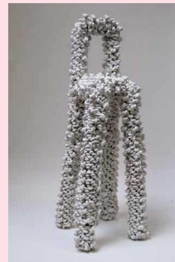
Midi triomphant, concept supranodal 2016, fer, coton acrylique, 124x43x43 cm