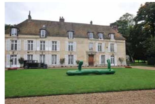
Château de Boisgeloup, Gisors, France, 2012 - With the Hispano Suiza of Pablo Picasso and the sculpture 'Mercury' (2004) by Franz West.

Cent ans après l'année de rencontre entre Picasso et la ballerine Olga Khokhlova, en 2017, Joe Bradley est invité à présenter ses œuvres à Boisgeloup dans l'atelier de sculptures.