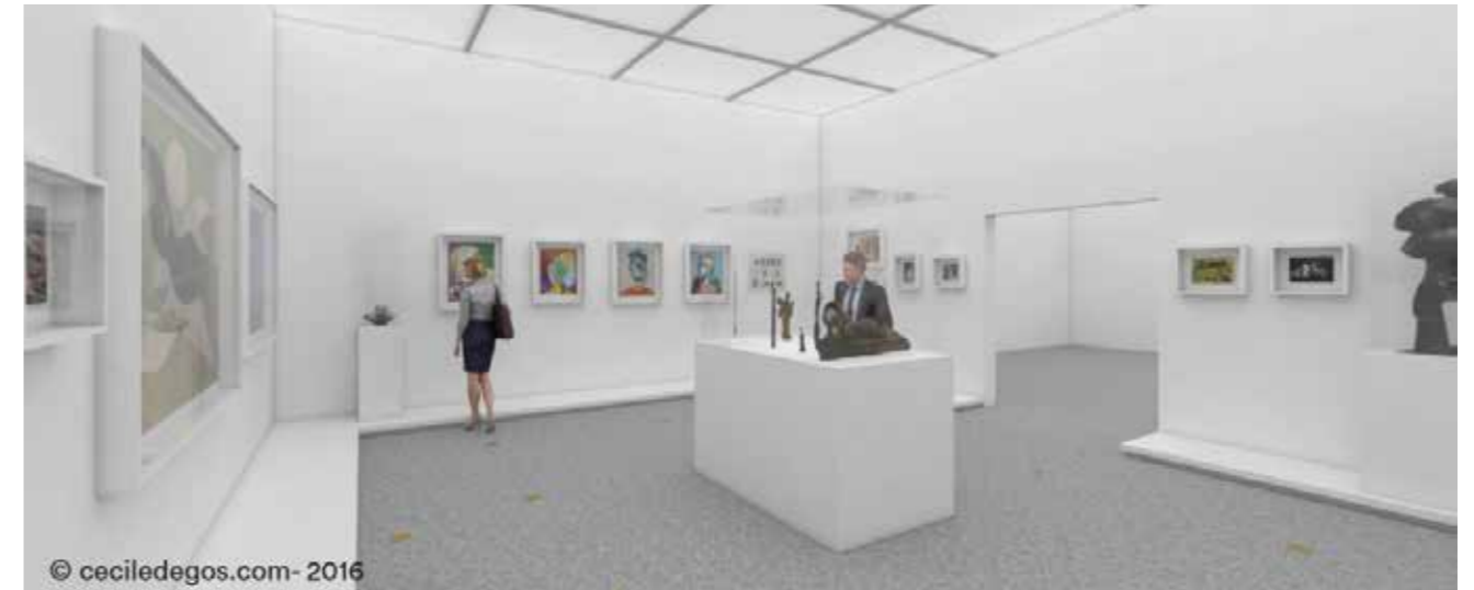
Musée des Beaux-Arts

La signalétique des trois espaces d'expositions est travaillée en étroite collaboration avec les services de la Métropole afin de garder une cohérence esthétique entre les trois lieux. Ce graphisme des expositions repose sur le rôle essentiel de la typographie : les différentes graisses des titres hiérarchisent les informations et initient un rythme de lecture. Les textes des cartels sont composés dans une typographie d'accompagnement choisie pour sa lisibilité. Textes et images dialoguent par un jeu de construction et d'imbrication et animent les différents espaces. De plus, un travail signalétique de directionnelle entre ces lieux permet d'accroître la cohérence du parcours.