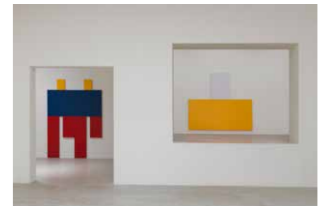
Joe Bradley at Le Consortium, Dijon, France (June 21 - September 28, 2014)

Exposition organisée par la Fundación Almine y Bernard Ruiz-Picasso para el Arte