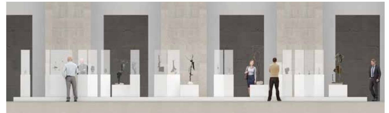
Musée Le Secq des Tournelles