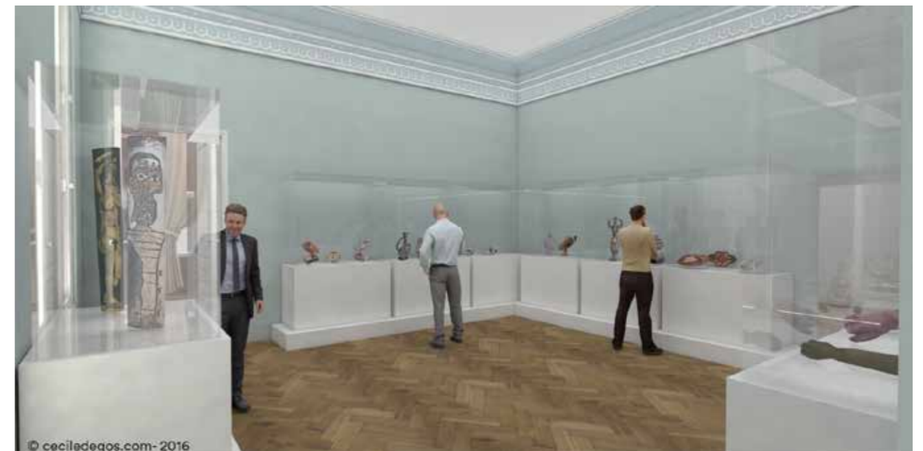
Musée de la Céramique