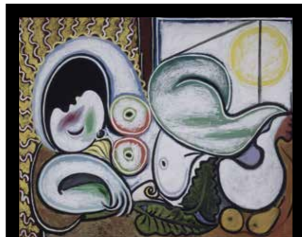
Pablo Picasso (1881-1973), Nu couché, Boisgeloup, 4 avril 1932, huile sur toile, 130 x 161 cm. Musée national Picasso-Paris, dation Pablo Picasso, 1979, MP142.

En juin 1930, Picasso acquiert le château de Boisgeloup près de Gisors. Tout en continuant à habiter à Paris, il fait de ce lieu une résidence de séjour, et surtout y aménage son premier atelier de sculptures. Secrètement amoureux de Marie-Thérèse Walter, il vit une période intensément créative, qui s'exprime également à travers la peinture, le dessin, la gravure et même la photographie. Ce moment rare, où l'inspiration renaît avec l'amour caché, est révélé pour la première fois en France dans une exposition rassemblant près de deux cents œuvres et documents grâce au Musée national Picasso-Paris et de collections privées. Autour de cette exposition, une véritable saison consacrée à la modernité sur le territoire de la Métropole Rouen Normandie sera organisée, en partenariat avec les universités et le label Ville et Pays d'art et d'Histoire.