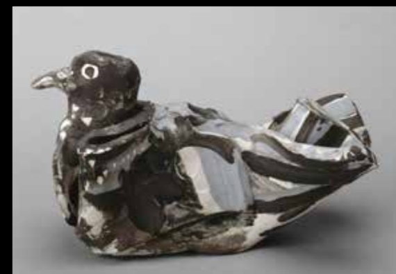
Pablo Picasso (1881-1973), Colombe, Vallauris, [1953], terre blanche : lastre modelée, décor aux engobes et incisions, 15 x 26,3 x 13,5 cm. Musée national Picasso-Paris, dation Pablo Picasso, 1979, MP3721.