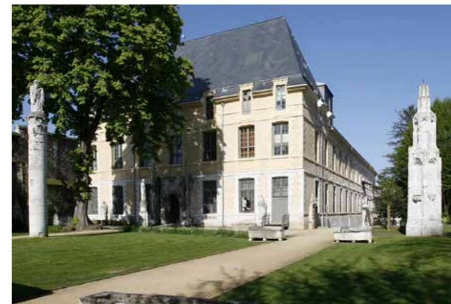
Le bâtiment abritant le Musée des Antiquités et le Muséum d'Histoire Naturelle, vue depuis le square Maurois

Voulu comme un «musée forum», ouvert sur les enjeux contemporains, le projet s'articule autour des notions clefs de la protection des patrimoines naturels et culturels, de la transition et de la transmission intergénérationnelle. Fort de ce positionnement, la définition du projet s'accompagnera d'une importante démarche de concertation citoyenne. Lancé en octobre prochain, ce travail de co-construction se concrétisera au premier semestre 2019 par des ateliers participatifs. Chacun sera invité à s'exprimer sur le «quoi», mais aussi sur le «comment» de ce musée d'un genre nouveau, situé en Coeur de Métropole et du nouveau Quartier des Musées.