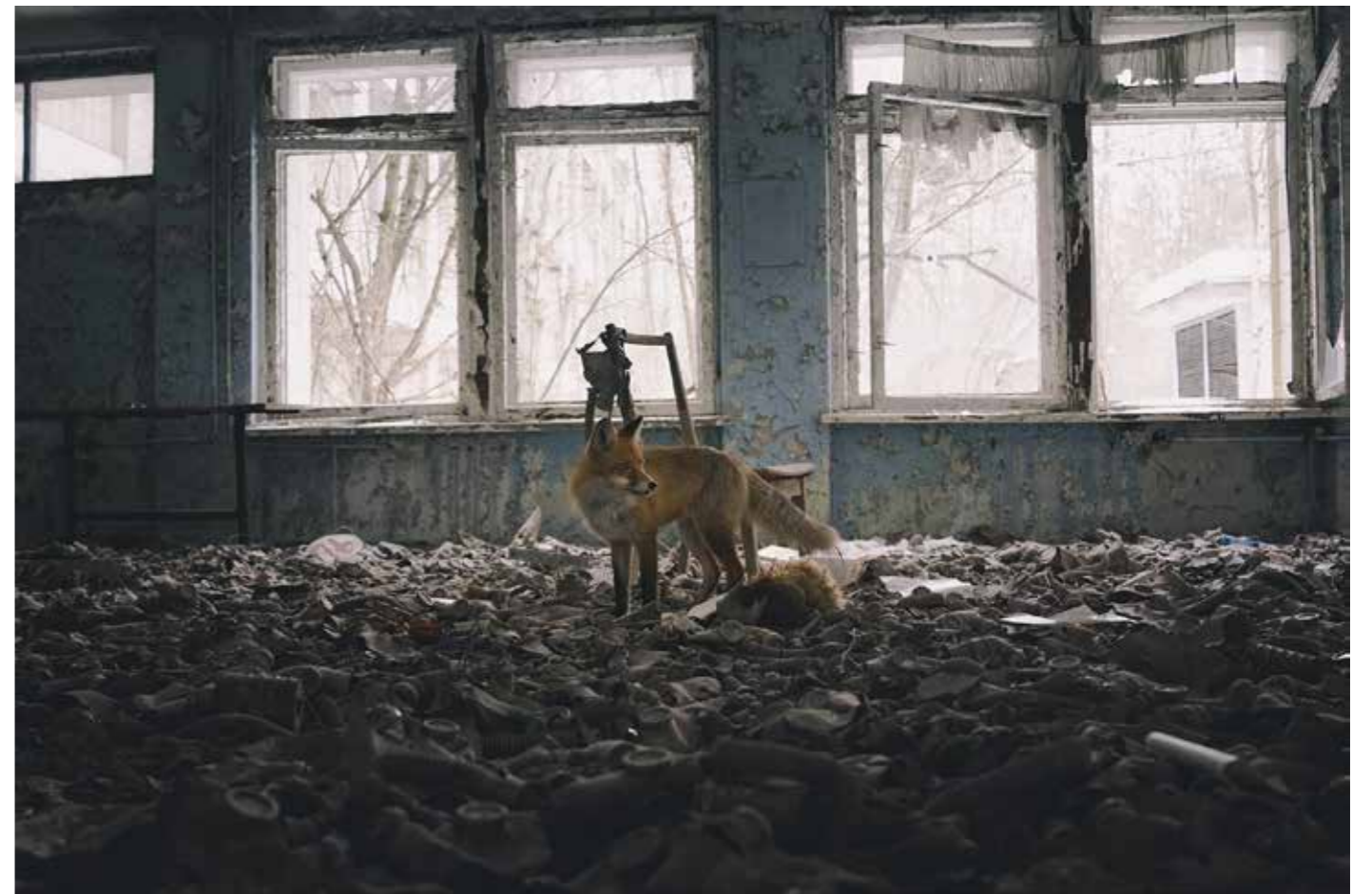
© Adrian Bliss - Wildlife Photographer of the Year