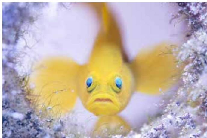
© Wayne Jones - Wildlife Photographer of the Year