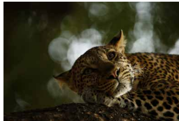
© Skye Meaker - Wildlife Photographer of the Year