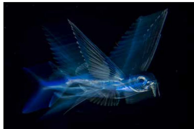
Wildlife Photographer of the Year