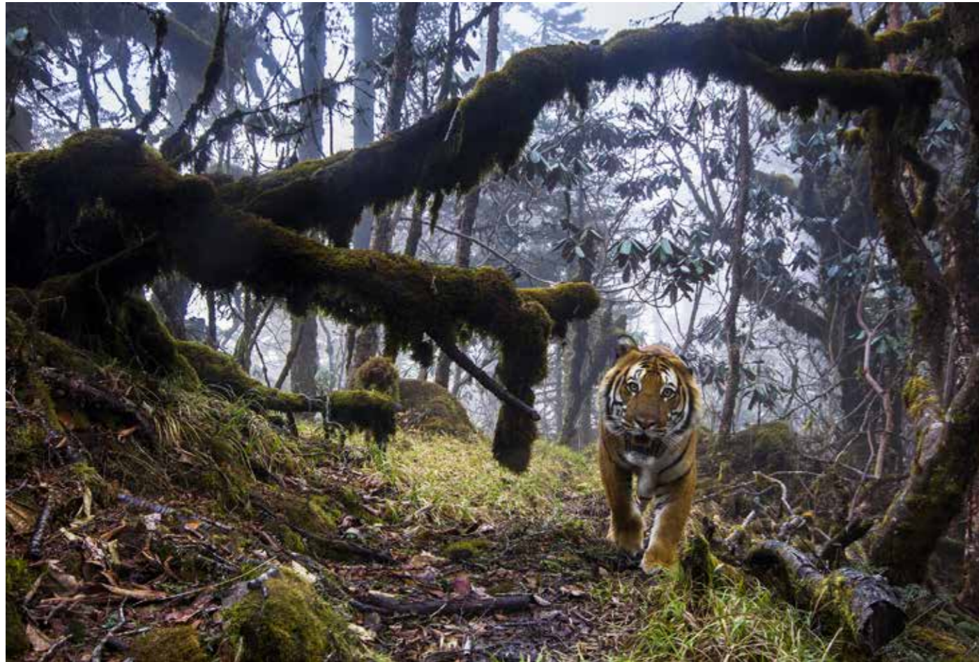
© Emmanuel Rondeau - Wildlife Photographer of the Year