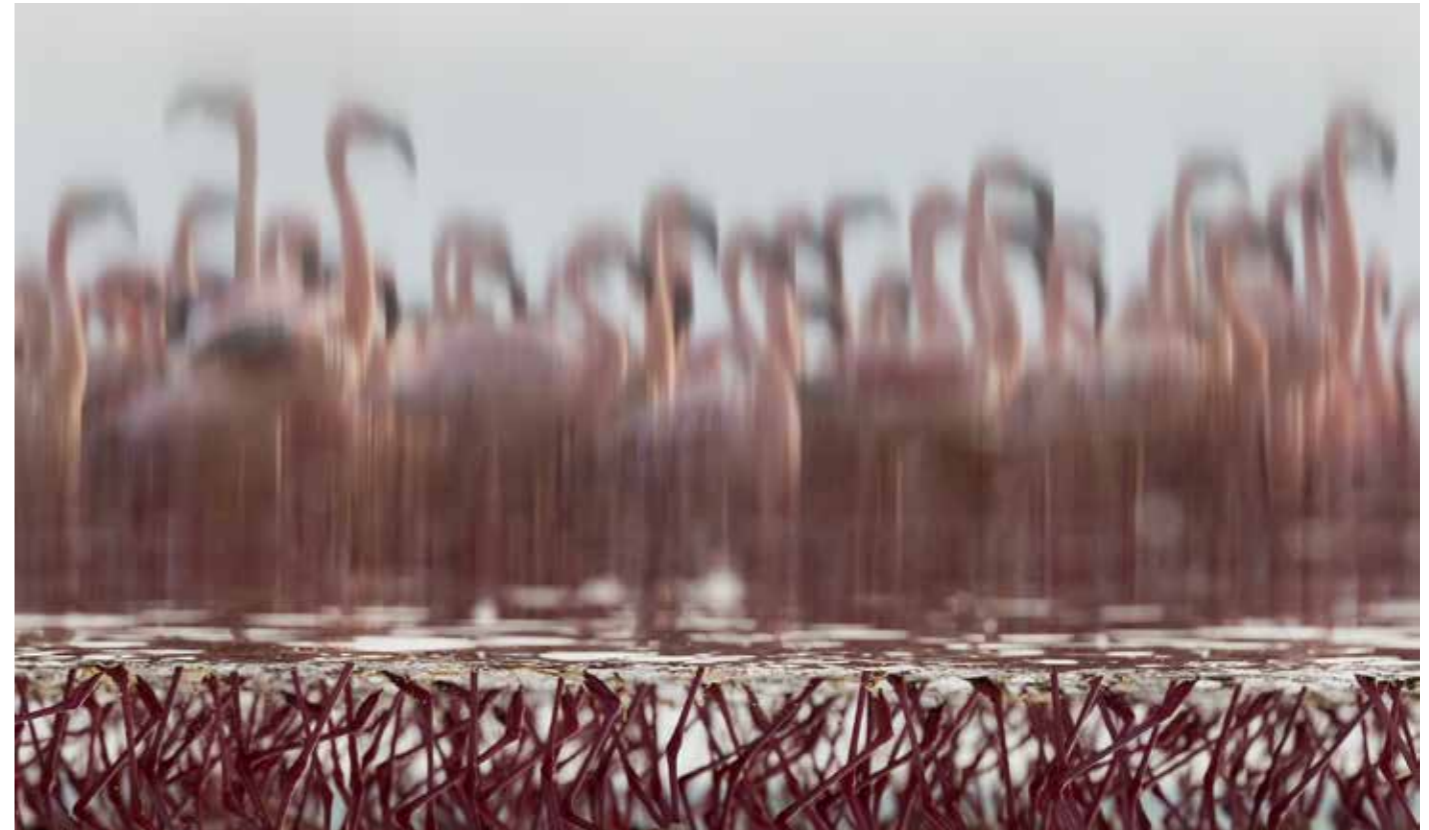
© Paul Mckenzie - Wildlife Photographer of the Year